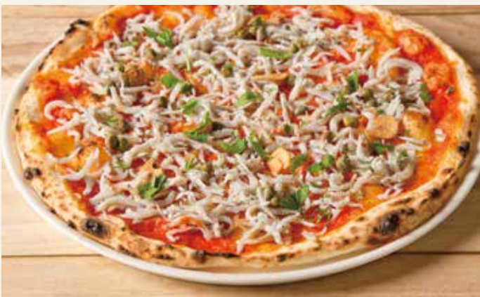
しらすガーリック