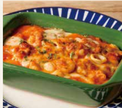
シーフードドリア 1,690(税込1,859)