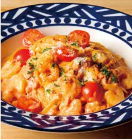
● 小海老とモッツアレラチーズの トマトクリーム 1,690(税込1,859)

ドリンクバー プラス 290(税込319) / ドリンク & デザートバー プラス 390(税込429)