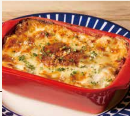
ミートラザニア 1,690(税込1,859)