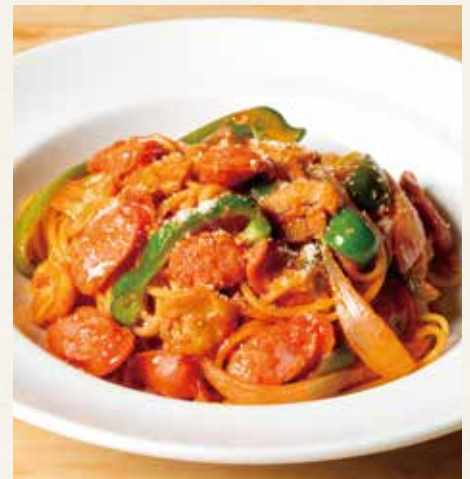
● ナポリタン 1,590(税込1,749)