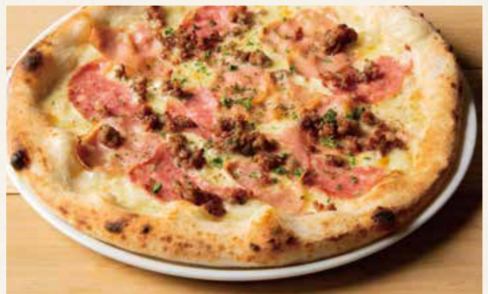
サルシッチャとイタリアンサラミ