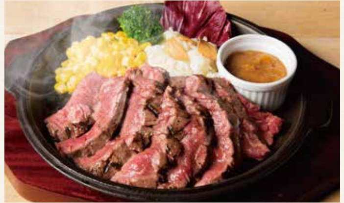
牛ハラミのグリル