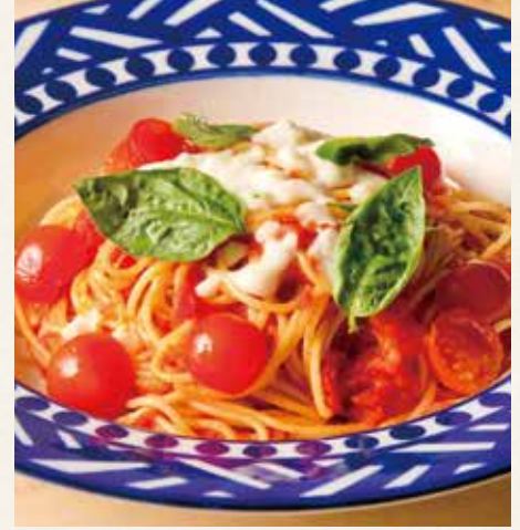
● チェリートマトとモッツアレッタチーズ 1,590(税込1,749)