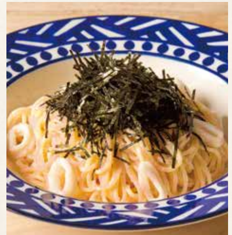
● 明太子クリーム 1,490(税込1,639)