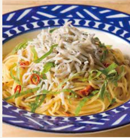
● しらすと大葉のオイルソース 1,690(税込1,859)