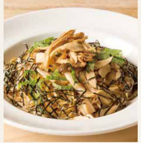
● きのこの和風醤油 1,490(税込1,639)